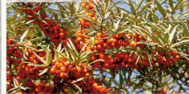
The Sallow thorn